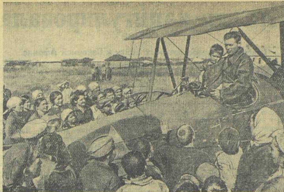
2. Советский лётчик прилетел в свой родной освобождённый город Дебальцево и беседует с земляками.